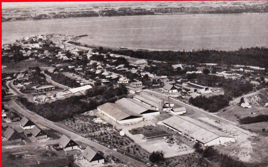
Når man sådan ser det lidt fra oven — viser det sig, at JAMO i Glyngøre ved Limfjorden dækker et ganske stort areal, ikke mindst efter udvidelsen.